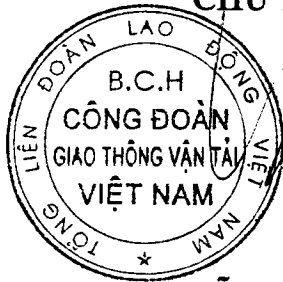
Đỗ Nga Việt